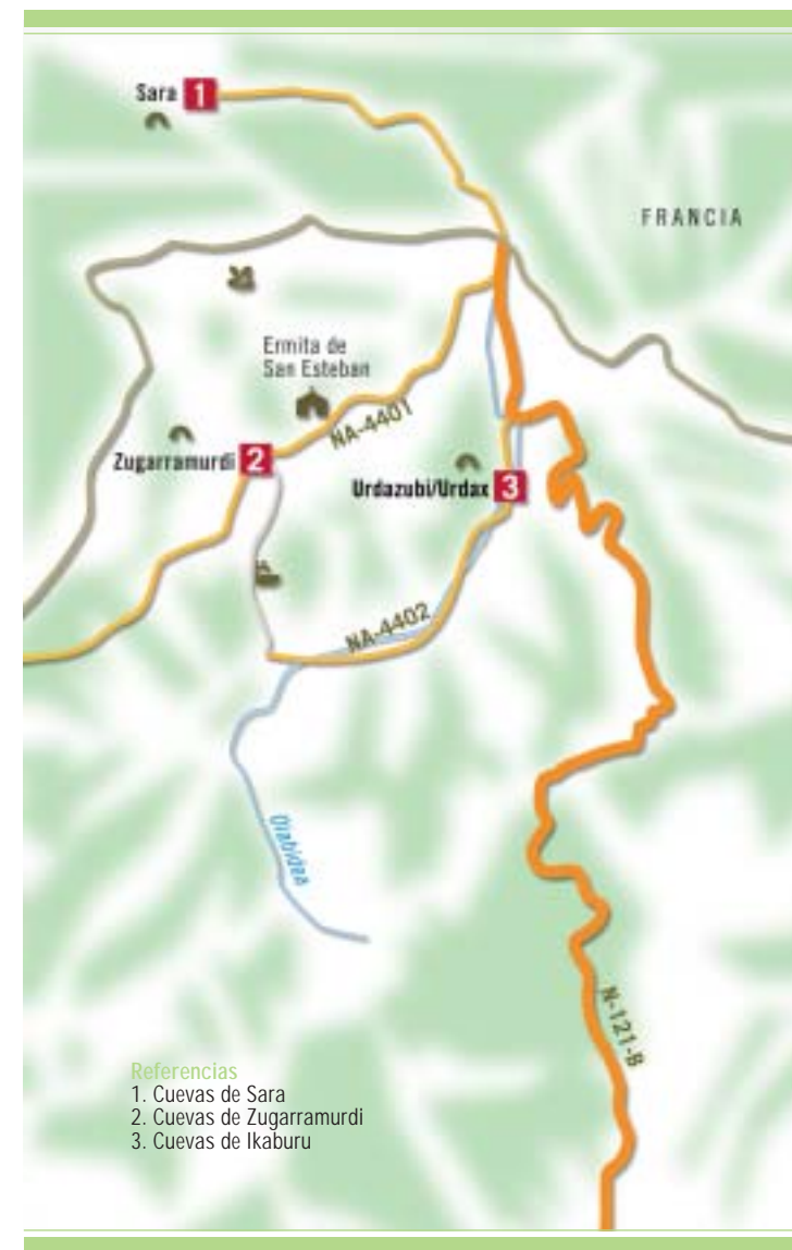
Referencias 1. Cuevas de Sara 2. Cuevas de Zugarramurdi 3. Cuevas de Ikaburu